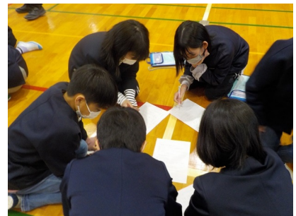
▲コミュニケーション授業（6年生）