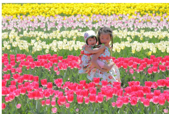
2018 たんとウチューリップまつり

〔問合せ〕 但東シルクロード観光協会 TEL 0796-54-1000 豊岡市但東振興局地域振興課 TEL 0796-54-1000