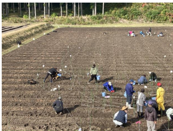
フラワーアート部分植付時の様子 (2021年11月1日)