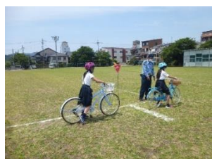
交通安全対策（自転車教室）