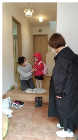
ファミリーサポートセンター事業（預かり時の様子）