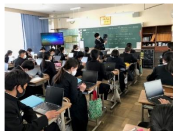
子どもたちのICT活用