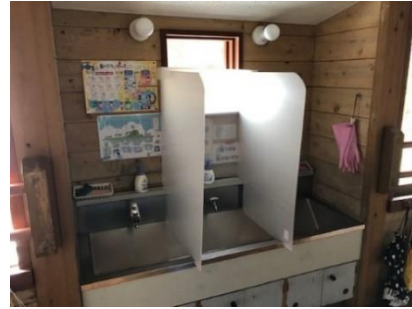
コロナ感染症対策（パーティション設置）