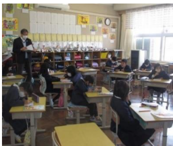
スーパーバイザー支援事業