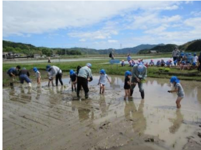
自然や身近な環境に関わる体験活動