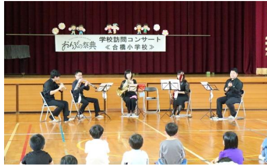
おんぶの祭典（学校訪問コンサート）