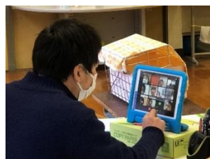
コロナ感染対策（オンライン健康観察）