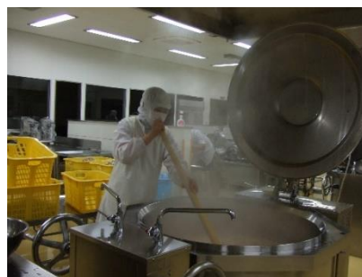
学校給食（調理の様子）