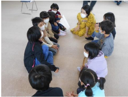
非認知能力向上の取組

IQ や学力テスト等の数値では表しにくい内面の力であり、保育、教育活動等を通して、繰り返し取り組むことで育つ力(やり抜く力、自制心、協働性 等)。