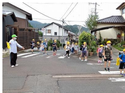
安全ボランティアの見守り活動