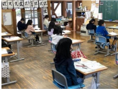
コロナ感染症対策（身体的距離の確保）