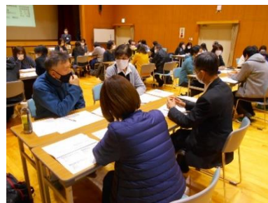
特別支援教育支援員研修会