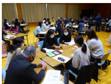
不登校担当者研修会

学校環境適応感尺度(ASSESS: Adaptation Scale for School Environments on Six Spheres)。学校生活に関するアンケートにより、児童・生徒の学校生活への適応感を総合的に測定する。