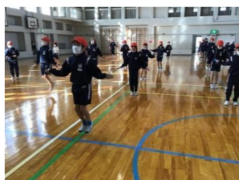
朝の時間、元気ハツラツ、笑顔で運動