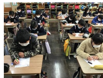
そして、「心」も「体」も落ち着いたところで、集中して問題に取り組む