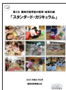
第2次スタンダードカリキュラム