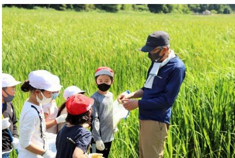
地域学校協働活動（生きもの調査）

子どもの基本的な生活習慣の確立と規範・人権意識の向上のため、「おはよう」「いってきます」「ただいま」「いただきます」「ごちそうさま」「おやすみなさい」「ありがとう」の7つの、基本となるあいさつを推進するもの。