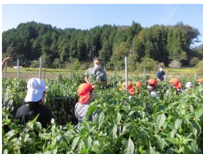
学校給食（ピーマン収穫体験）