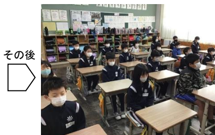
運動の後、「動」から「静」にメリハリをつけ、静かに黙想