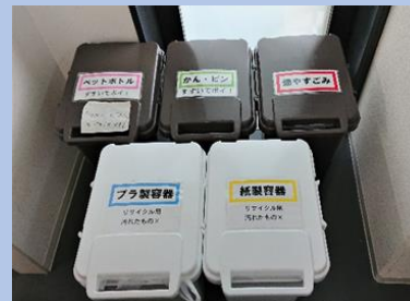
分別すれば資源、捨てればごみ