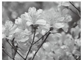
コバノミツバツツジ

早く咲く鮮やかな花 ミツバツツジは、大きくなって3mほどの落葉低木です。低地では3月半ばから4月にかけて、あざやかな紅紫色の薄紫色の花を咲かせます。多くの木々や他の花々に先駆けて咲くので、よく目立ち、蜜は虫たちのよい食料になります。昔はギフチョウが訪れる姿を見ることができましたが、最近是非常にまれになりました。