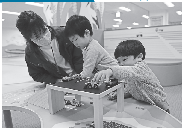
ミニカーなどで遊べるジオラマテーブル