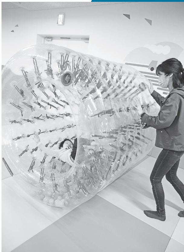
バランス感覚や集中力が身に付くサイバーホイール