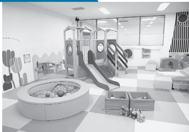
全身で思いっきり遊べる遊具を完備