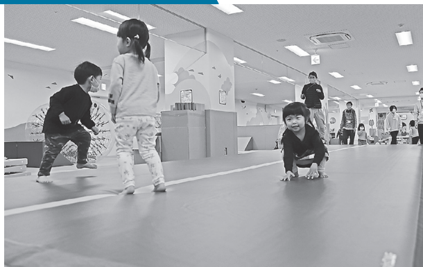
トランポリンのように跳ねるエアマット