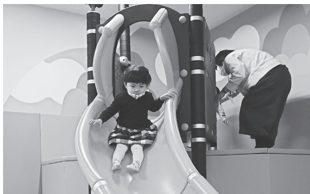
ブロックを登って滑る築山スライド