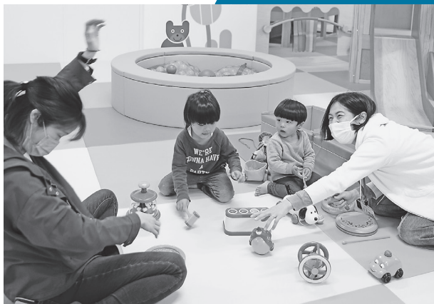
親子で安心して遊べるベビーエリア

はいはい・ヨチヨチの子どもが安心して全身で思いっきり遊ぶことができるゾーンです。