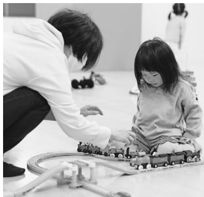
7階から移動する子育て総合センター

就学前乳幼児0～5歳と保護者を対象にした子育て支援機関です。アイティ7階から移転しました。これまでと同様に子育てに関する情報提供や講座実施、育児相談、子育て親子の交流場所の提供や交流促進などを行います。