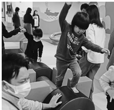
天候を気にすることなく遊べるこども広場

0歳から小学生までの子どもと保護者が天候を気にすることなく安全に体を動かして遊ぶことができる屋内型の遊び場です。