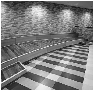
多様な人たちが集い、交わる場となる市民交流広場

子ども、子育て中の親、学生、高齢者、外国人など多様な市民の皆さんが交流する場所です。市民交流スペースや学習室、図書コーナー、カフェなどを配置しています。また、学習室では、多文化共生を推進するため外国人を対象に生活相談や日本語教室などを定期的に実施する予定です。