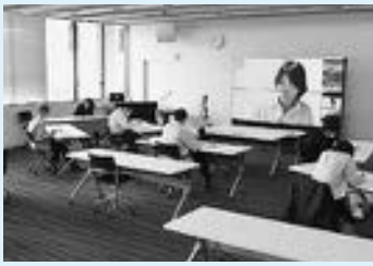
▲リモートで行われた研修会。やさしい日本語の言い換えでは、実際に外国人との会話を想定し練習を行った