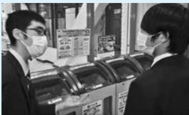
▲動画撮影は、コープデイズ豊岡などで行われた