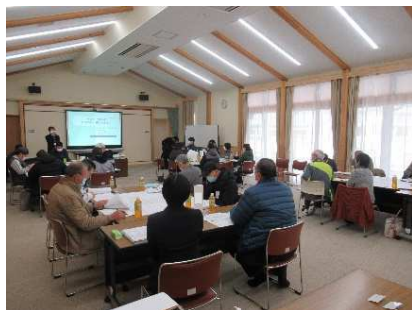
当日の会場全体の様子