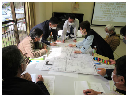
Bの意見交換の様子