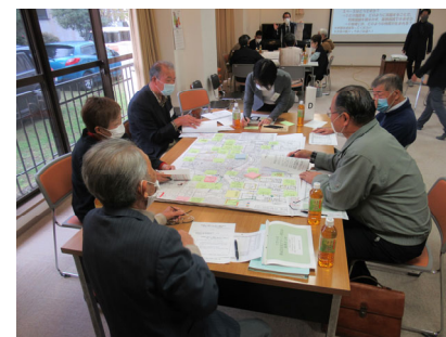
Dの意見交換の様子