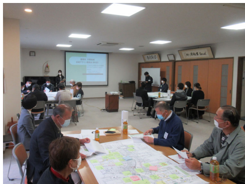
当日の会場の様子