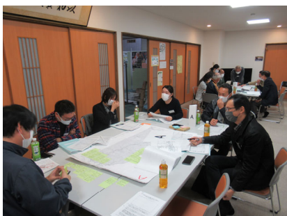
Aの意見交換の様子