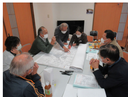
Cの意見交換の様子