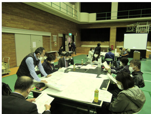
A・Bの意見交換の様子