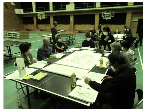
C・Dの意見交換の様子