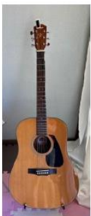
ピアノやギター伴奏で歌おう