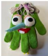
手作り教材で 楽しくサポート