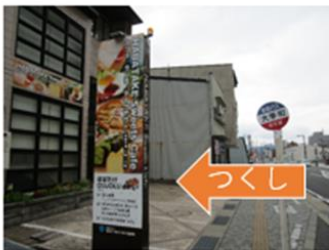
豊岡市大手町7-9 はばたけOLUOLU 1階