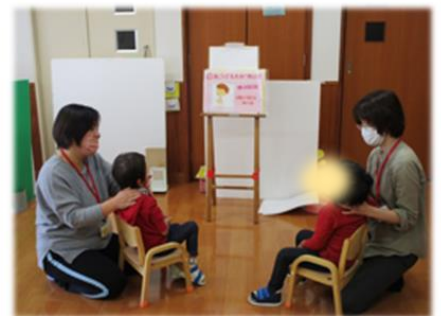
療育士とおくちの体操(重心グループ)

住所：豊岡市戸牧 1029-11 TEL:0796-22-8688 FAX:0796-22-8811