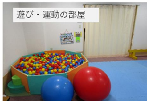
遊び・運動の部屋