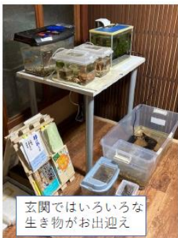
玄関ではいろいろな 生き物がお出迎え