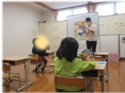
はじまりの会(就学前)