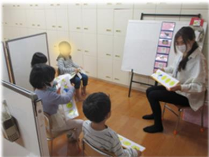
はじまりの会(幼児)