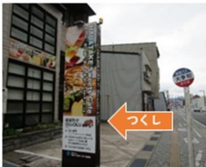
豊岡市大手町7-9 はばたけOLUOLU 1階