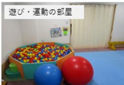
遊び・運動の部屋