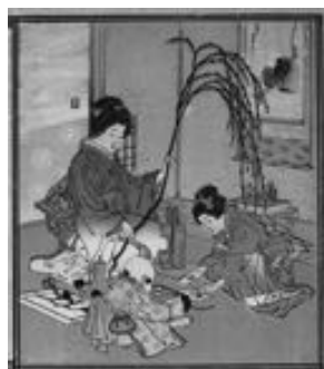
▲正月の準備を描いた「引き札」(昔のチラシ)