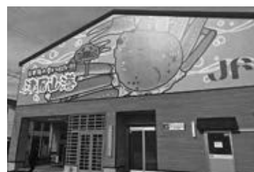
▲フィッシャーメンズ・ビレッジ

また、港エリアにある十数件の宿や、城崎温泉でもご賞味いただけます。今年の冬は、家族でおいしい津居山かにを楽しんでみてはいかがでしょうか？