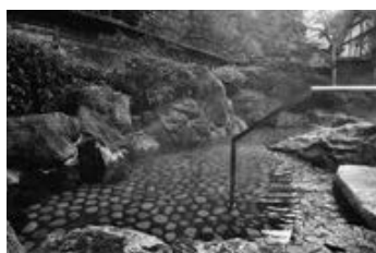
▲ジオの恵みを受けている城崎温泉(湧の湯)