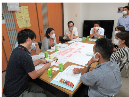
Aの意見交換の様子