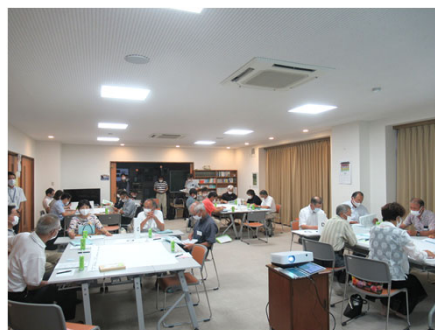
地区の発表の様子