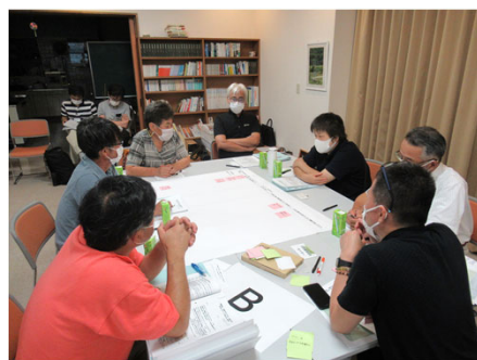
Bの意見交換の様子