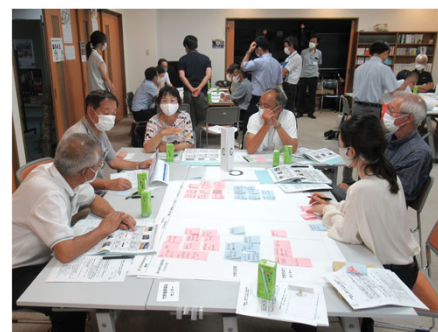
Cの意見交換の様子