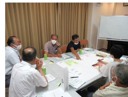
Dの意見交換の様子