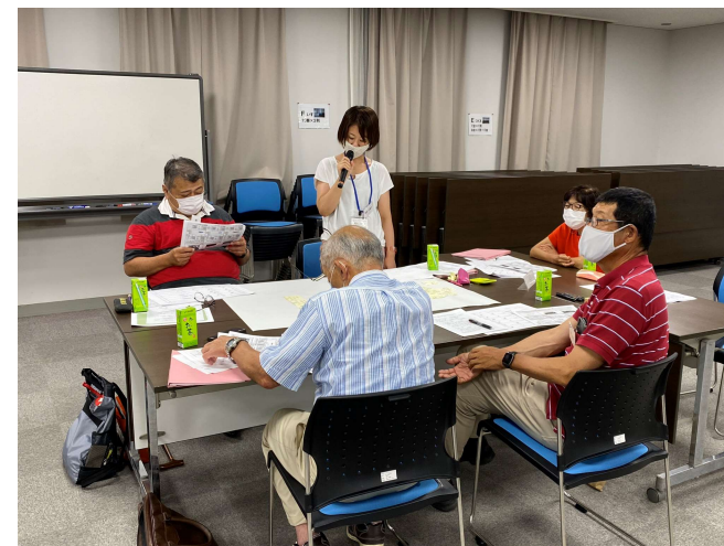
各テーブルの発表