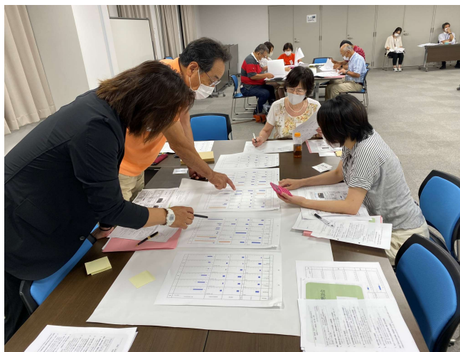
各テーブルの様子