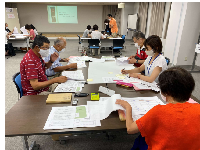
各テーブルの様子