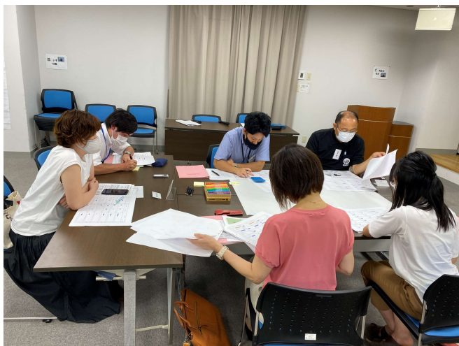
各テーブルの様子