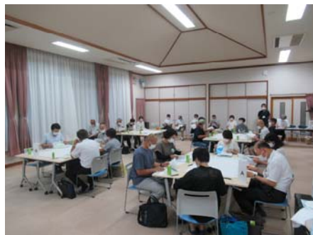
当日の会場全体の様子