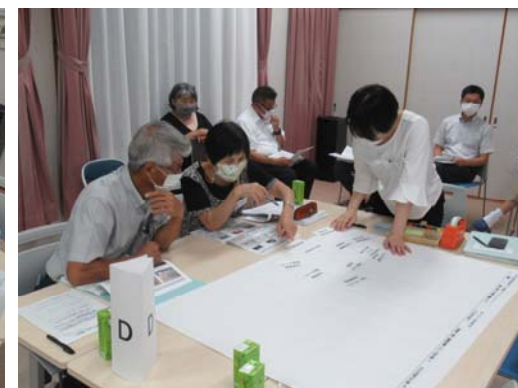
Dの意見交換の様子