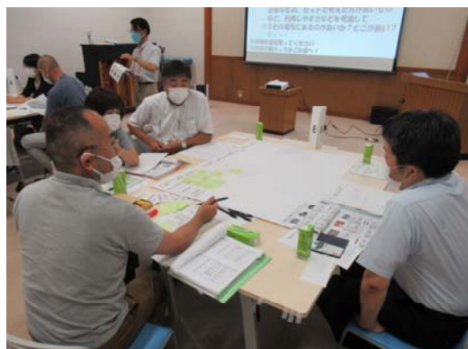
Bの意見交換の様子