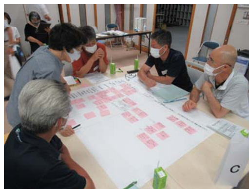
Cの意見交換の様子