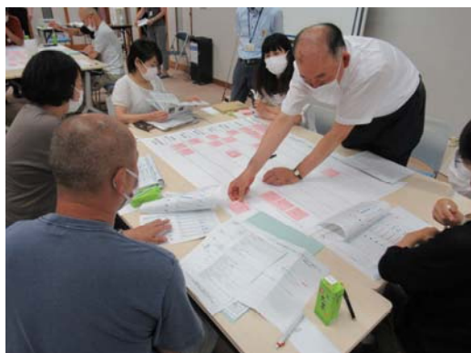
Aの意見交換の様子