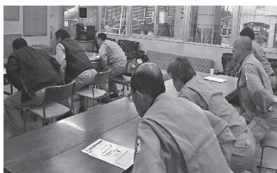
▲事業所で健康講話を聞き、スクワットに取り組む皆さん