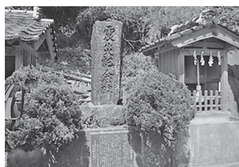
▲豊岡市田結地区震災記念碑 1925年北但大震災の際、救助より消火活動を優先した住民の行動が減災の好例として知られている

災害発生への備えとして代表的なものにハザード(防災)マップがあります。ハザードマップとは、その地域の土地の成り立ちや災害の原因となる地質・地形、過去の災害履歴などの防災地理情報を基に起こりうる災害を想定し、被災想定区域や避難場所・避難経路、防災関係施設などを地