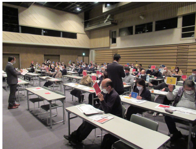
公共施設の利用実態等の確認（旗揚げチェック）