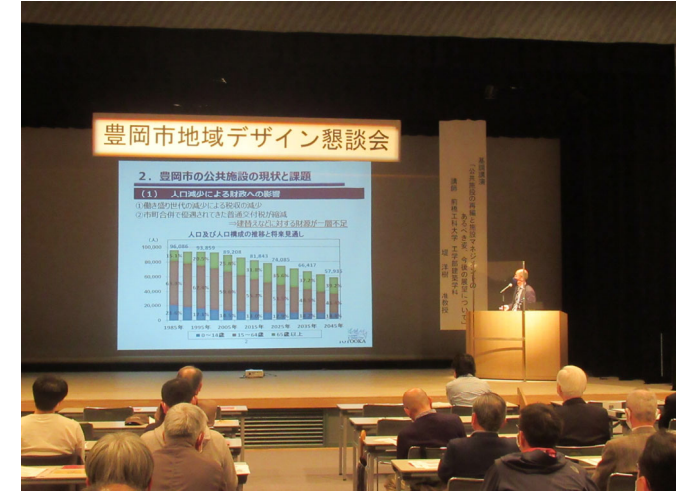
豊岡市公共施設マネジメントの取り組み説明