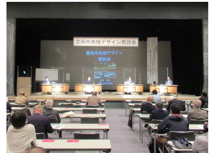
意見交換会・鼎談