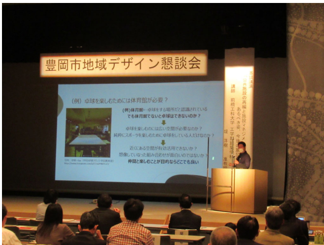
堤准教授の基調講演