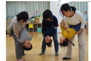
逆さまになって「こんにちは！」 (子育て総合センター)