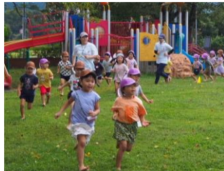
朝ジョグ、レッツゴー！

▲全園児・全職員で、毎朝たっぷり体を動かした遊びを楽しみます。 【みかたの森こども園】