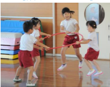
【仲良しカンガルー】

▲片足クマで、友達の丸太橋を踏まないように気を付けて進もう！ 【竹野認定こども園】