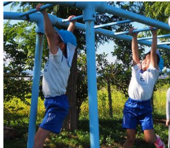
うんていチャレンジ！

▲全園児・全職員で、毎朝たっぷり体を動かした遊びを楽しみます。 【みかたの森こども園】