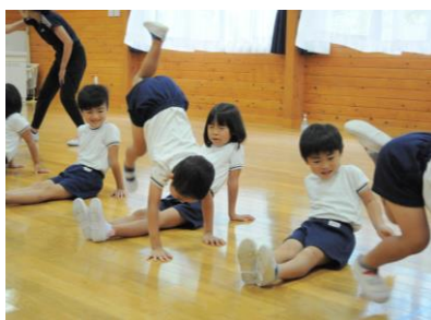
【丸太橋チャレンジ】

▲片足クマで、友達の丸太橋を踏まないように気を付けて進もう！ 【竹野認定こども園】