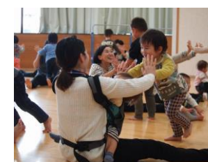
親子運動遊びの様子