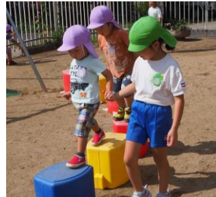
異年齢の温かな関わり

◀友達と一緒に頑張ったり、励まし合ったりして、色々な運動遊具に挑戦しています。 【新田幼稚園】