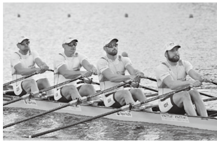
▲「KINOSAKI」のロゴを付けたドイツ男子スカルチーム