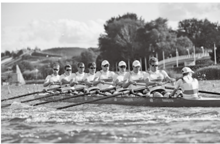
▲ボート競技エイト種目ドイツ代表チーム