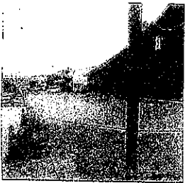
(写真) 旧いづたや跡地 市が買収済

現在豊岡市九日市上町にある「但馬高齢者生きがい創造学院」の移転先として、市が買収済みの豊岡市大手町旧いづたや跡地に令和2年度豊岡市一般会計予算で約2億5千万円の「生涯学習サロン」の建設事業費が計上され、8月建物建築入札の予定でした。これが今回の補正予算で「旧いづたや跡地の陶芸窯を含む建物整備は中止、陶芸窯はアイティ7階、その他