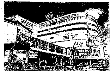
(写真) 再開発ビル「アイティ」 さとうは核店舗

いずれにしても「補正予算が通らなければ「さとう」が撤退する」という乱暴な議論ではなく、落ち着いて対話や調査をすすめる知恵を集めて市民が納得できる結論を得たいと考えます。