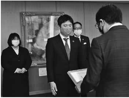
▲表彰状を受け取る(株)ユラクの皆さん

あんしんカンパニー2020(豊岡市ワークイノベーション表彰)は、女性にとって働きやすさ・働きがいなどが高い水準に達している市内事業者を表彰する制度です。