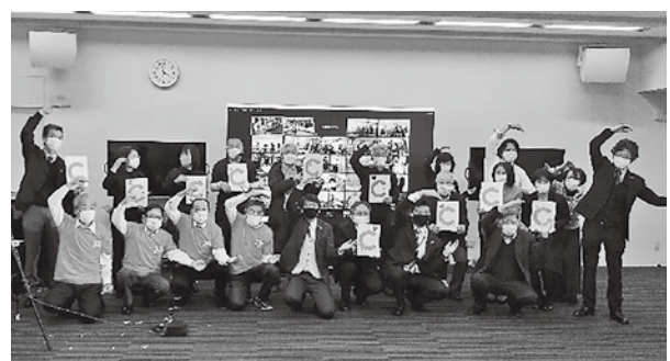
▲会場とオンライン参加者との記念撮影