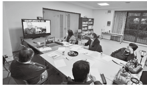
▲コミュニティセンターからオンラインで参加

インでの参加と各地域単位で設置した会場での参加を合わせて約150人が相互に学び合い、地域コミュニティづくりの気運を高める様子が見られました。