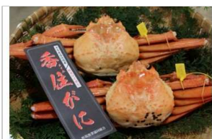
タグ付き香住ガニ(ボイル)約800g×2枚