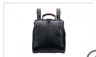
豊岡鞆 YOUTA LIZARD 3WAY 縦ダレス(YK-3M)ブラック