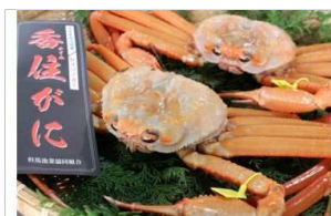
タグ付き香住ガニ(生)約800g×2枚