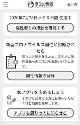
▲アプリの画面イメージ

接触確認アプリは、新型コロナウイルス感染症の感染者と接触した可能性について、通知を受け取ることができるスマートフォンのアプリです。お互いに分からないようにプライバシーを確保し、新型コロナウイルス感染者と接触した可能性について通知を受け取ることができます(1m以内、15分以上の接触)。