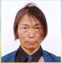
清滝地区 西口 覚 日高町頃垣