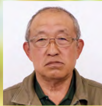
港地区 絹本 實 豊岡市気比