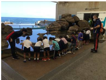
▲ 2年生 9/29 マリンワールド見学