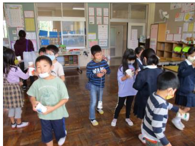
▲ 1年生 10/16 松ぼっくりけん玉

来年4月の統合に向け、港東小学校と港西小学校では、小小連携教育の中で児童の交流を図っています。