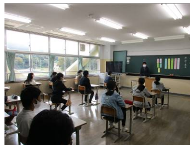
▲ 6年生 11/6 港中1日体験授業