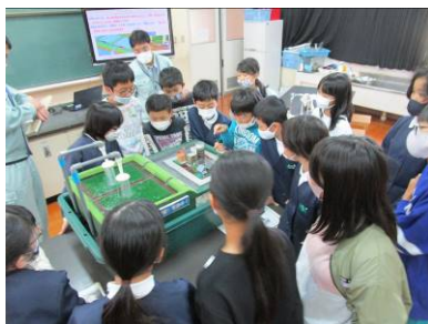
▲ 5年生 10/26 合同環境学習