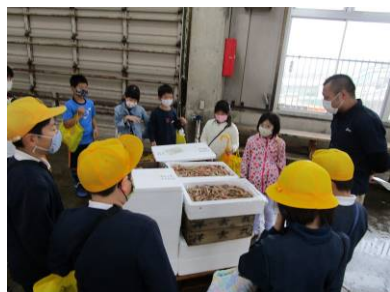
▲ 4年生 10/8 津居山漁港見学