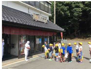
▲ 3年生 9/29 二方蒲鉾訪問