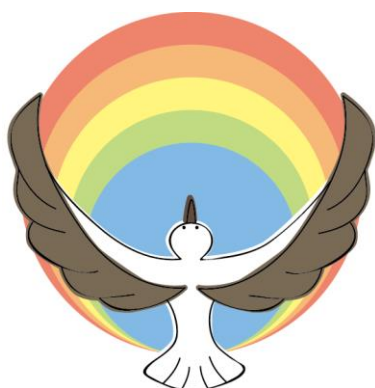
「みらい応援制度」シンボルマーク

豊岡市は2020年度から、非認知能力向上を目的に、市の主催する有料の文化芸術事業へ、ひとり親家庭のこどもたちを招待する「 みらい応援制度 」を創設します。