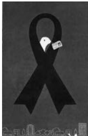
移植医療のシンボル「グリーンリボン」

臓器移植は、第三者の善意によって成り立つ医療です。一人一人が臓器移植について考えてみませんか。