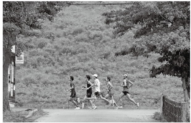
▲推薦作品 「爽快に走ろう」

《問合せ》兵庫神鍋高原マラソン全国大会事務局(スポーツ振興課内) ☎21-9023