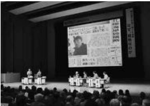
▲パネルディスカッション(2015日本冒険 フォーラム)