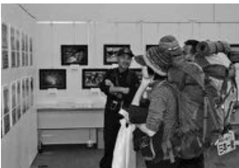
▲チャレンジャー紹介のパネル展示