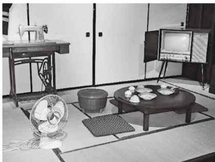
▲昔の茶の間を再現

じゃあ、今度は古代の衣装を着て、写真を撮ってもらうつもりだから、一緒にそっちの写真も撮ってくるわ。