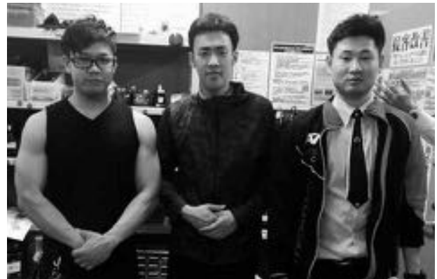
▲祝、優勝!!「チームUFO」の皆さん

健康づくりに時間を割けない働く世代が、6月の1カ月間「職場対抗“歩キング”選手権」に挑戦しました。今回は22チームと多くの参加者がありました。賞品の食事券の魅力もさることながら、いろいろな効果を感じてもらえたようです。回を重ねるごとに、健康づくりの輪が広がってきています。皆さんも、まずはいつもより「あと10分」「歩くこと」から始めてみませんか？