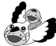
◀ファミサポ イメージキャラクター サポちゃん