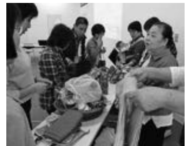
▲子育てグッズを確認する会員