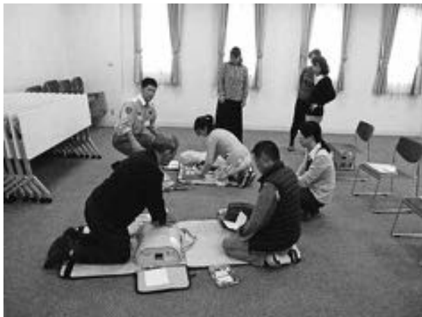
▲救急救命講習を受けるまかせて会員