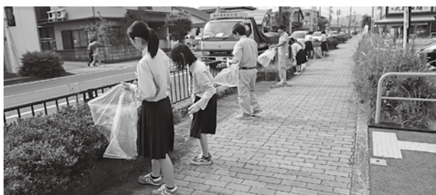
▲インターアクトクラブが道路をきれいに

6月19日、幹線市道であるアイティ前から宮島交差点までの大開一日市線で、豊岡総合高校の生徒が、市職員と一緒に花壇や歩道の除草作業とごみ拾いなどの清掃作業を行いました。