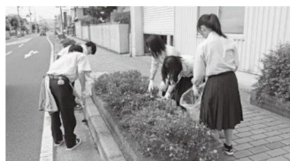
▲草むしりをします

参加した生徒は同校インターアクトクラブに所属する1～3年生の11人。生徒らは2班に分かれ、ごみ袋を片手に手作業で草を抜いていきました。