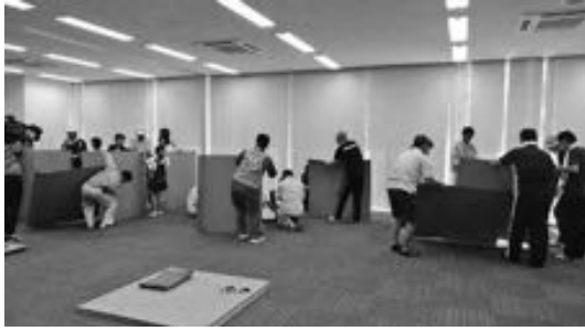
昨年の訓練(段ボールベッドの組み立て)

いつどこで発生してもおかしくない地震災害に備え、市民総参加による地震発生後の安全確保訓練、安否確認訓練(沿岸部は津波避難訓練)を実施します。市民の皆さん、率先して参加してください。《問合せ》防災課☎23-1111