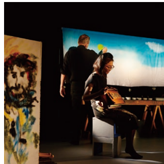
Teatro all'improvviso "Là in alto / Là-haut"

1978年よりイメージや詩的感覚、動きに焦点をあてた作品を発表し続け、世界各国で上演を行うイタリアの児童劇団。特に3~8歳の子ども達を対象とし、予想のつかない展開や感覚に訴えかけ、時に挑発しながらも虜にする作風が特徴。2017年の『うつくしいまち』以来、2度目の城崎滞在となります。