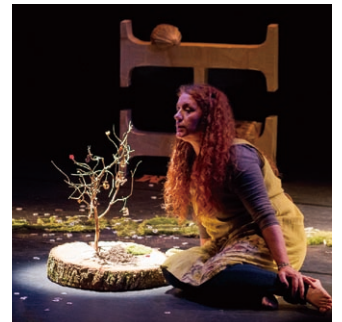
Compagnie Sémaphore "Au fil des mots..."

フランス・アルザス地方を中心に活動する児童劇団セマフォーは、語りと俳優という要素に重点をおき、子ども達それぞれの想像力や思考力が引き出されるような作品創作を目指しています。今回の城崎滞在が初来日です。