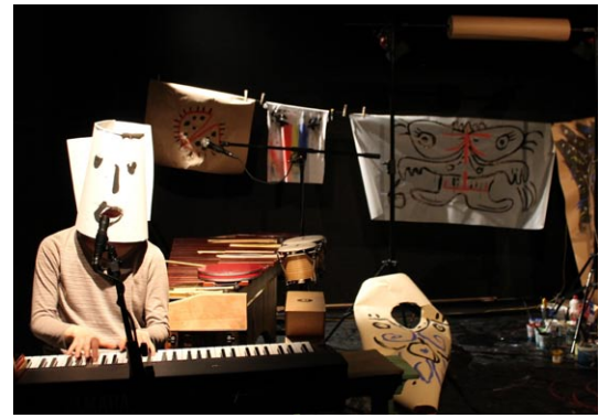
フランス・アルザス地方でのリハーサルの様子(2018)

ともに子どものための舞台作品を創作し近年交流を深めてきた、イタリア・マントバを拠点に活動するテアトロ・インプロヴィーゾとフランス・アルザス地方を代表する児童劇団セマフォーが城崎国際アートセンターにやってきます。「空想の」「素晴らしい」「奇抜な」といった意味を持つことば「ファンタスティック」をテーマに、童話や文学、絵画や音楽など、世界中の様々な芸術や文化に登場する空想の生き物についてのリサーチ、豊岡市内でのフィールドワークやワークショップをインスピレーションにして、夏休みに家族と一緒に楽しめる舞台作品を創作し、上演します。