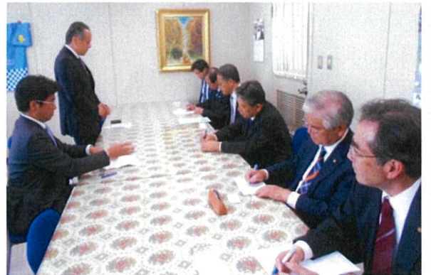
山口企画県民部長