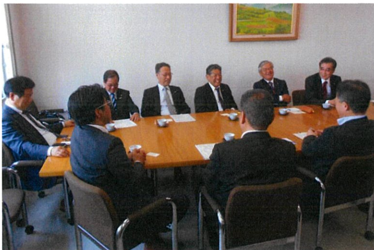
濱県土整備部長ほか