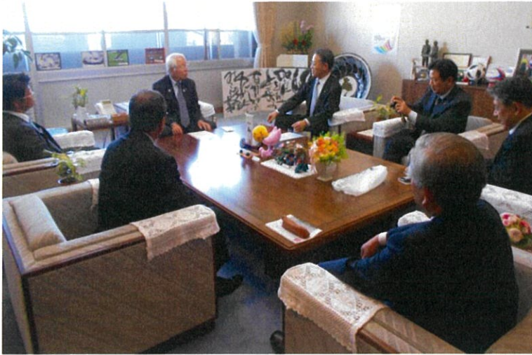
井戸知事を表敬訪問