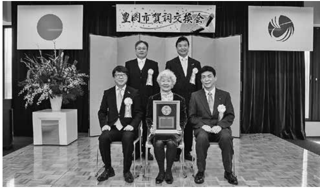
問 秘書広報課 ☎23-1114