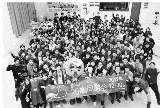
2017 豊岡市 25 歳同窓会（平成 29 年 12 月 30 日）