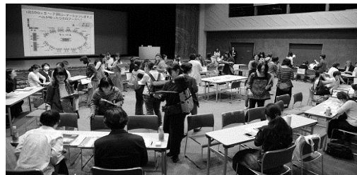
子育て・お仕事大相談会

※1 ( 勤務シフトや業務の細分化等により、 1日当り1～3時間、あるいは週1～2 日等の超短時間勤務での仕事 )