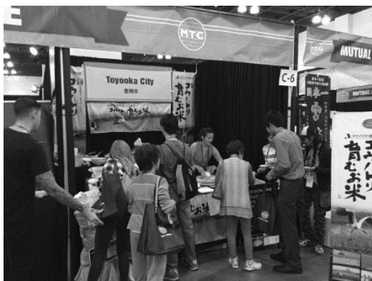
豊岡ブース(ロサンゼルス)