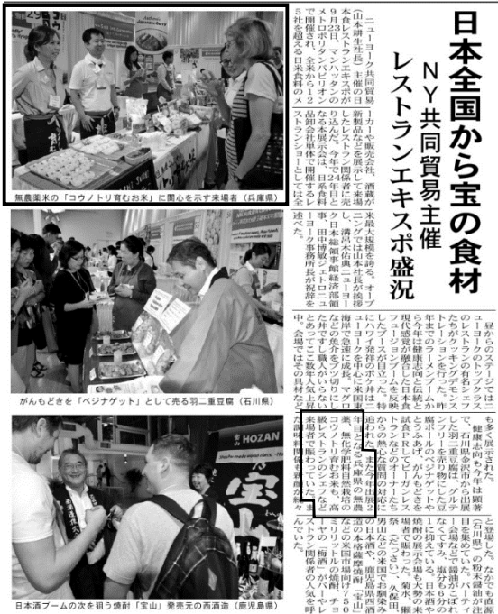
「週間NY新聞(2017年10月7日)転写

週刊NY生活 SHUKAN NEW YORK SEIKATSU [総合] (6)