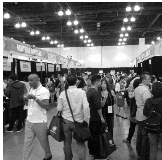
日本食レストランエキスポ会場(ロサンゼルス)