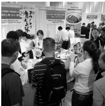
豊岡ブース(ニューヨーク)

週刊NY生活 SHUKAN NEW YORK SEIKATSU [総合] (6)