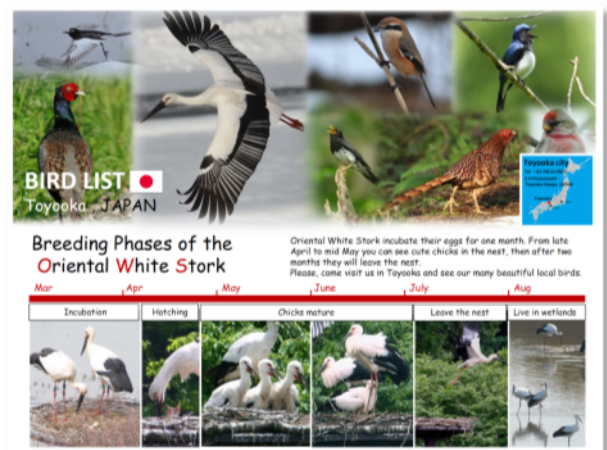
掲示するポスター例(イメージ)