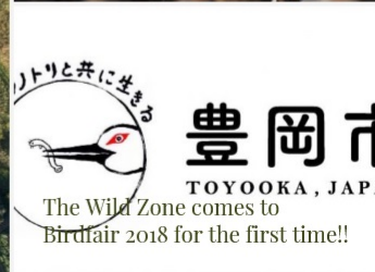
トップページに張付けられた「豊岡市のバナー」