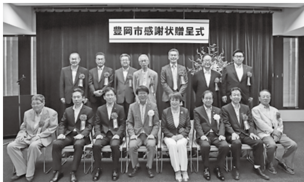
贈呈式後の集合写真