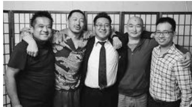
第6回選手権優勝チームの皆さん