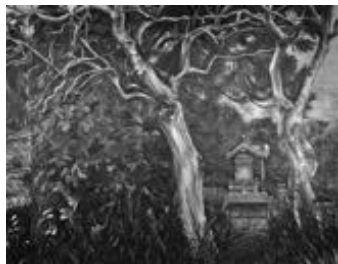
昨年の高校の部 市長賞受賞作