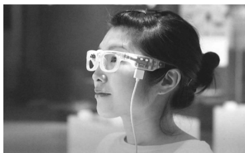
（オトングラス・イメージ）

オトングラス（視覚障害者向けに開発された、書類や図書などの文字を音声で読み上げる機器）を、竣工日に設置する。