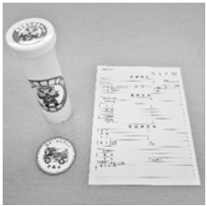
【キットの内容】 保管容器 マグネットシール 医療情報記録用紙

命活動につなげるものです。配布を希望する方は、問合せ先に連絡してください。既にキットをお持ちの方は、医療情報記録用紙の内容の確認・更新をお願いします。