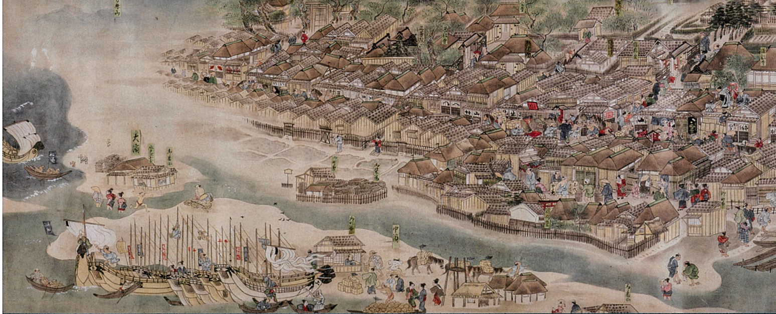
「秋田街道絵巻」伝 萩津 勝孝(上巻・土崎湊部分)より 秋田市立千秋美術館蔵